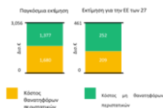
Διάγραμμα 2: Κόστος των τραυματισμών και των ασθενειών που σχετίζονται με την εργασία στην κοινωνία, 2019 (σε δισ. EUR)

Πηγή: «Διεθνής σύγκριση του κόστους των ατυχημάτων και των ασθενειών που σχετίζονται με την εργασία» (EU-OSHA, 2017), εκτίμηση με βάση δεδομένα της Eurostat και της Παγκόσμιας Τράπεζας.