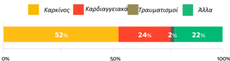
Διάγραμμα 3: Αιτίες θανάτων που συνδέονται με την εργασία (σε ποσοστό %) στην ΕΕ 54